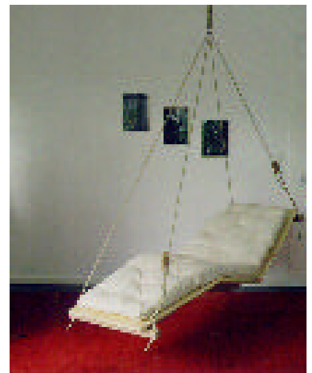
Modell Legend I